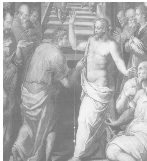
MIO SIGNORE E MIO DIO!