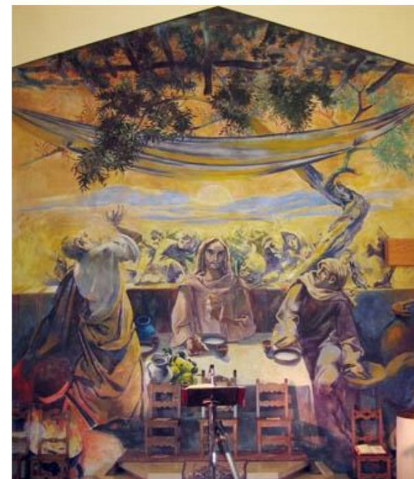
Il quadro dietro l'altare voluto da Albino Luciani