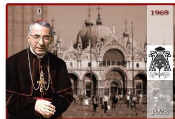
Il patriarca di Venezia Albino Luciani 1969-1978